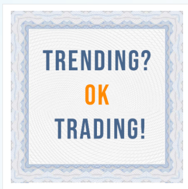
Copertina del Documento