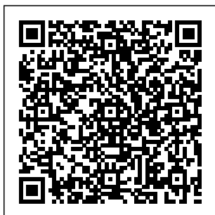
QRcode NFT #ID

NFT #ID C2ujFjf3ihpDnbUK6cqy5yRTeY81Gj4nfJJu7hsATtVv